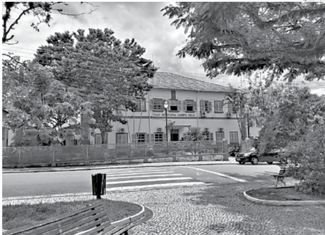
EXPEDIENTE administrativo na prefeitura voltou ao horário normal de 8 às 17 horas

Outra medida estabelecida diz respeito à medição da temperatura corporal de cada um dos frequentadores da igreja ou templo religioso, sendo totalmente vedada a participação de pessoas que se encontrem com temperatura corporal acima de 37°C, bem como aquelas que apresentem sintomas gripais compatíveis com o novo coronavírus, cabendo ao responsável da instituição religiosa a comunicação da ocorrência aos órgãos de saúde pública do município e orientar essa pessoa a procurar imediatamente atendimento médico.