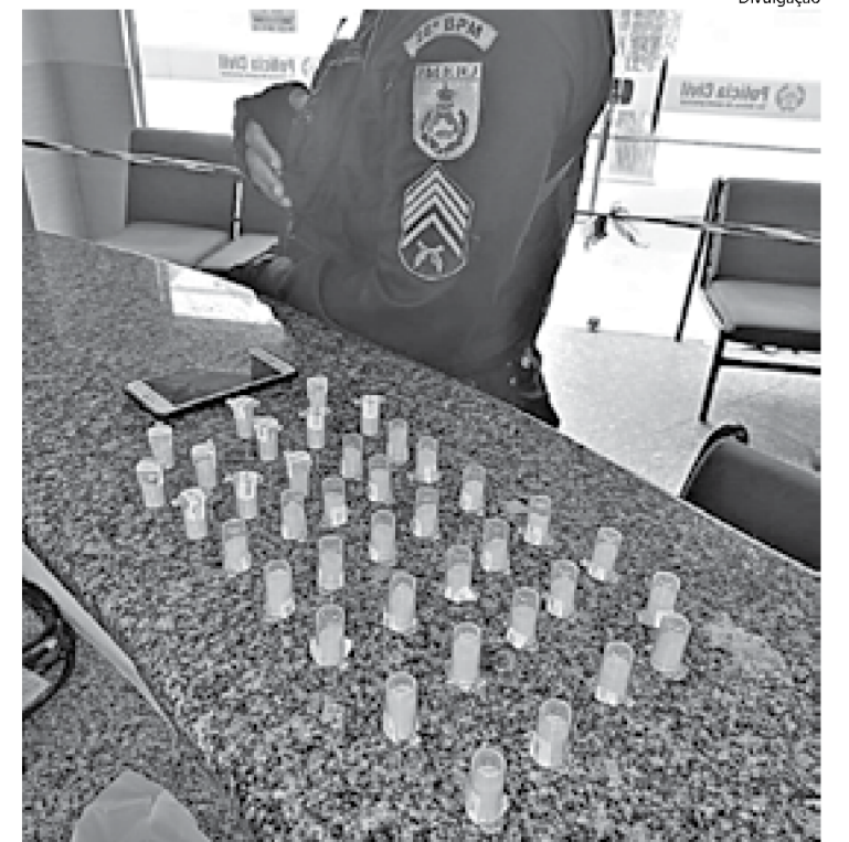
A DROGA apreendida no Água Limpa foi apresentada na 93ª DP